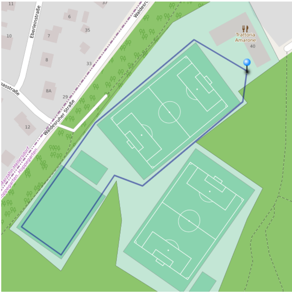
1,5 km Jedermann